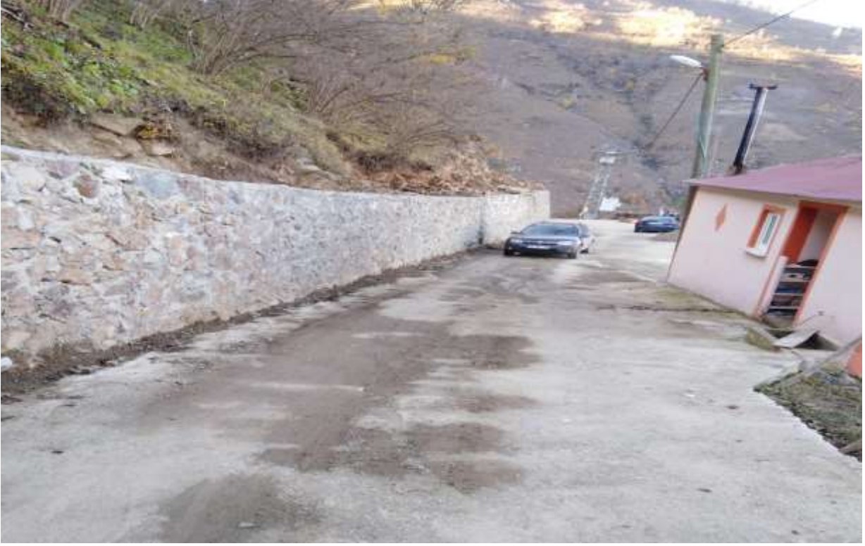
Kürtün Üçtaş Köyü Taş Duvar Yapım İşi