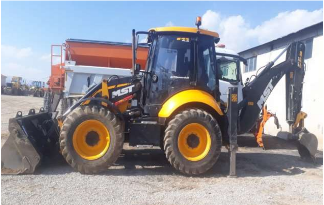
2020 Yılında Alınan Kanal Kazıyıcı - Yükleyci