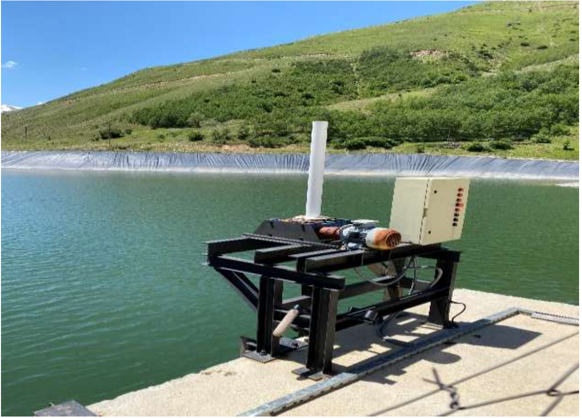
Torul – Gzeloluk Ky- Hidroelektrik Santrali