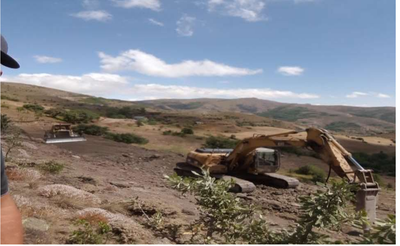
Merkez Geit Ky Arazı Yolu Yapım İŖi