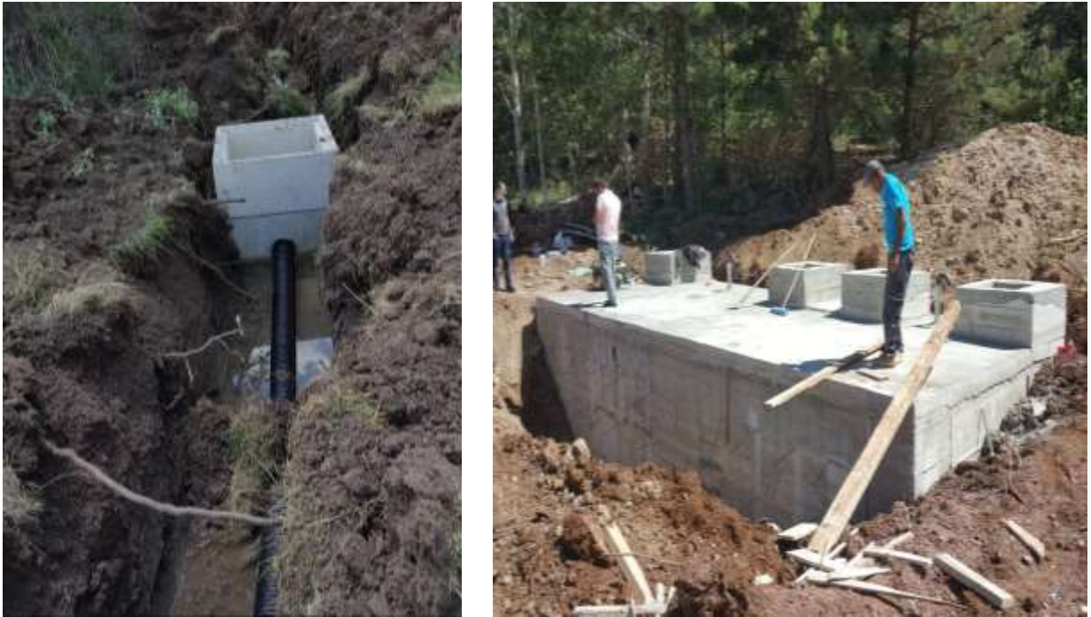
Şiran İlçesi Yeniköy Köyü Kanalizasyon Hattı ve 250 Kişilik Fosseptik Yapım İşi