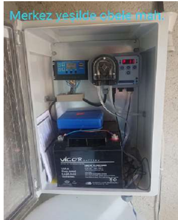
Merkez Yeşildere Köyü Klorklama Cihazı