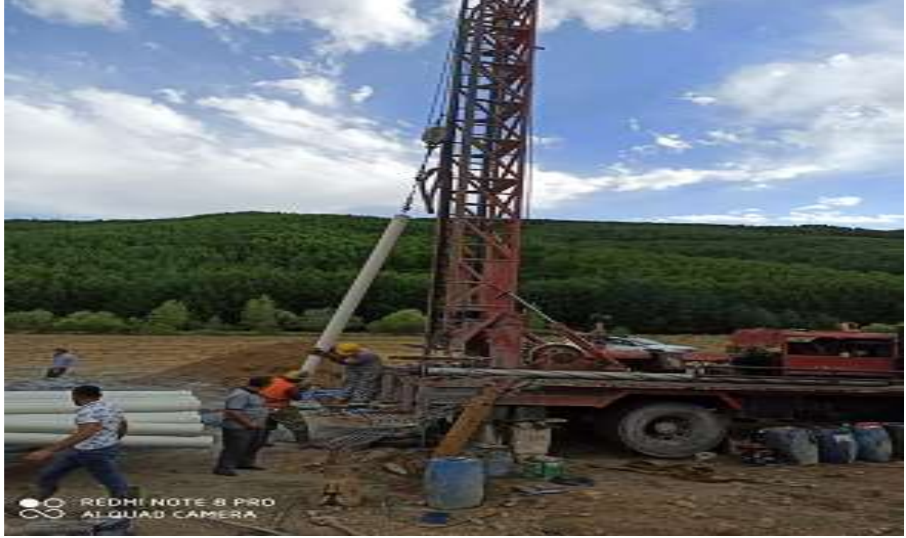
Kelkit Yenyol Jandarma Karakolu Sondaj İşİ