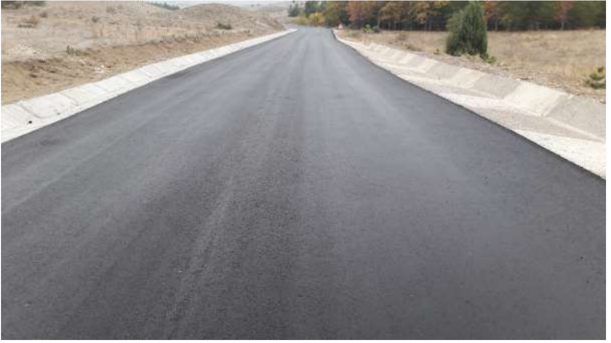
Şiran Sarıca Tomara Şelalesi Yolu