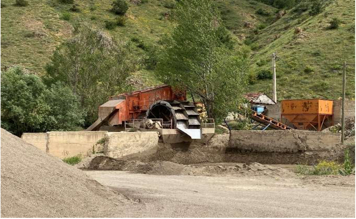
Kelkit - Söğütlü Belediyesi Kum-Çakıl Ocağı