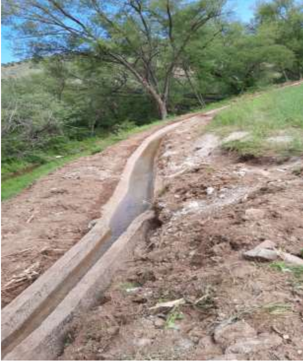
Merkez Gökdere Köyü Beton Kanal İşi