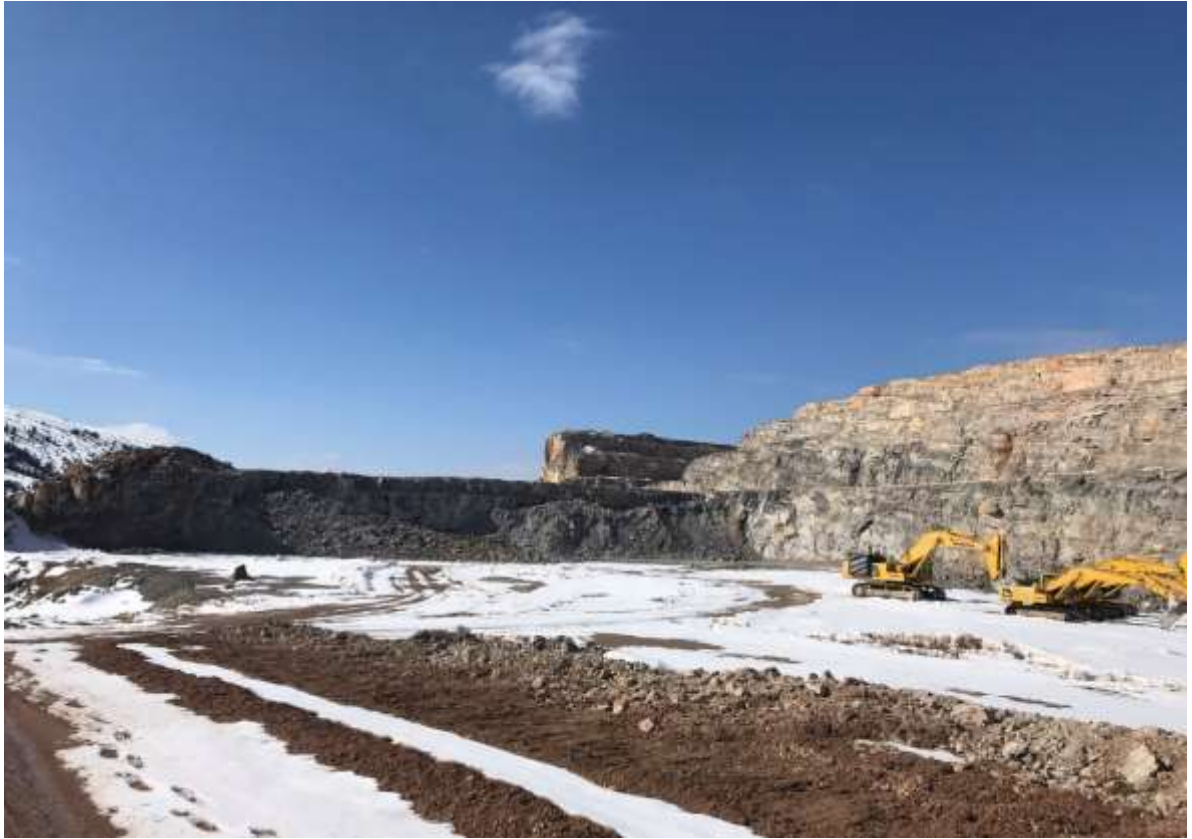
Merkez – Tamzı Köyü – Kalker Ocağı Maden Sahası – Düzgün Basamak Geometrisi