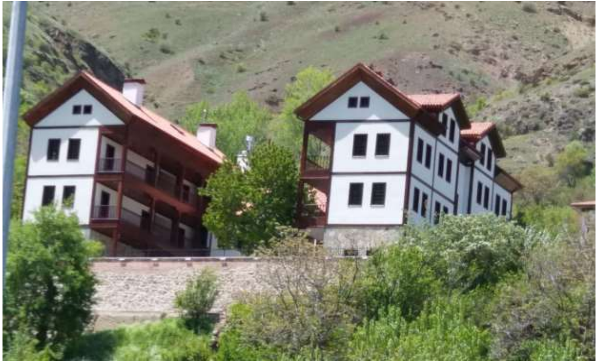
Merkez Sleymaniye Kltr Kompleksi