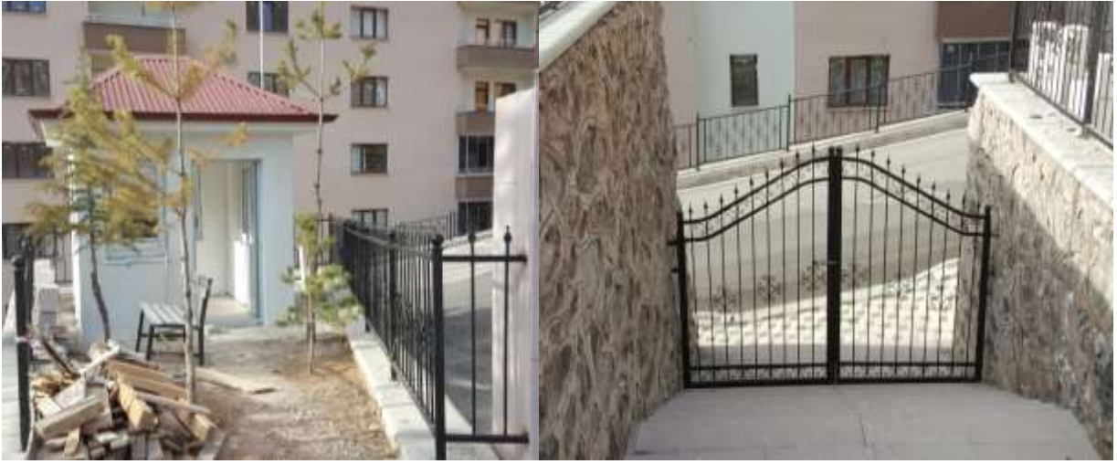
Merkez M. Ç. Sosyal Bilimler Lisesi Bekçi Kulübesi ve Demir Kapı Yapım İşi