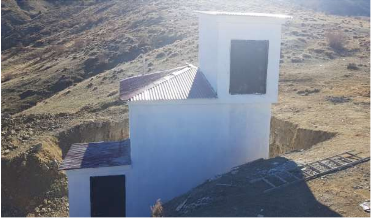
Kelkit Balkaya Köyü İçme Suyu Deposu