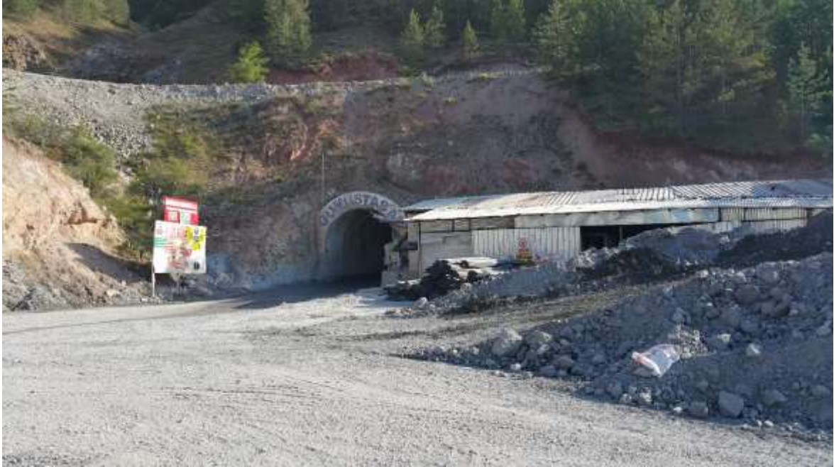
Merkez - Karşıyaka Mah. (Kurşun-Çinko- Bakır- Gümüş Altın) Maden Sahası - Gümüştaş Madencilik ve Tic. A.Ş.