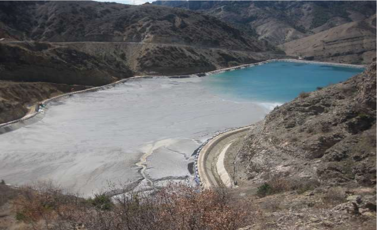
Merkez - Demrikaynak Köyü - Altın Madeni İşletme Sahası - Koza Altın A.Ş.