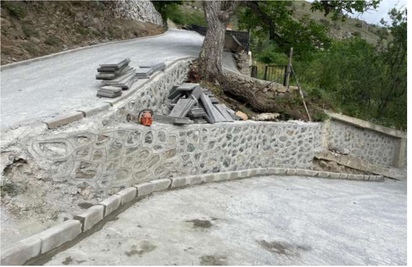
Şehit Öğretmen Necmettin Yılmaz Mezarlığı Yol Yapımı