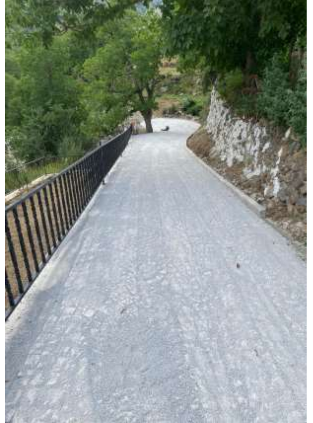
Şehit Öğretmen Necmettin Yılmaz Mezarlığı Yol Yapımı