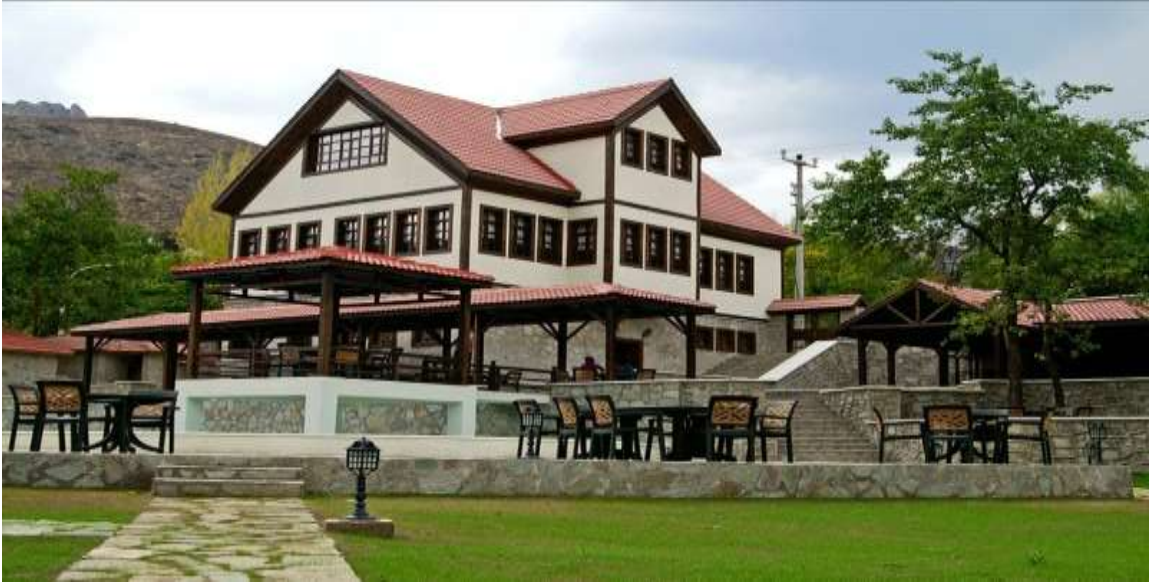
Merkez Balyemez Konađı