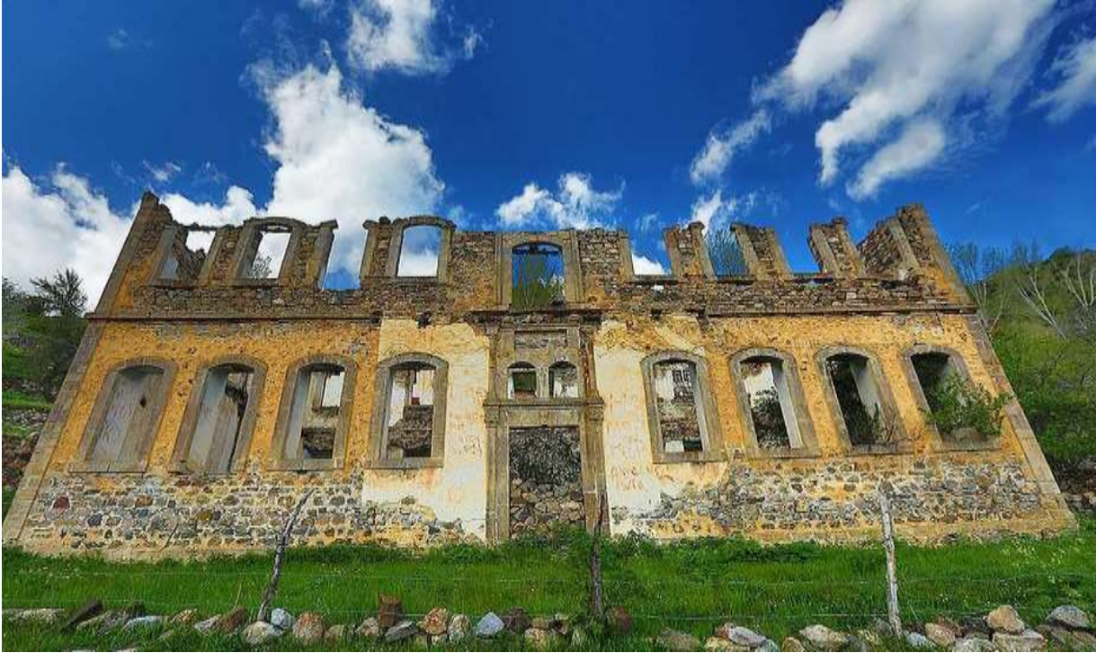
Merkez Süleymaniye Rum Okulu