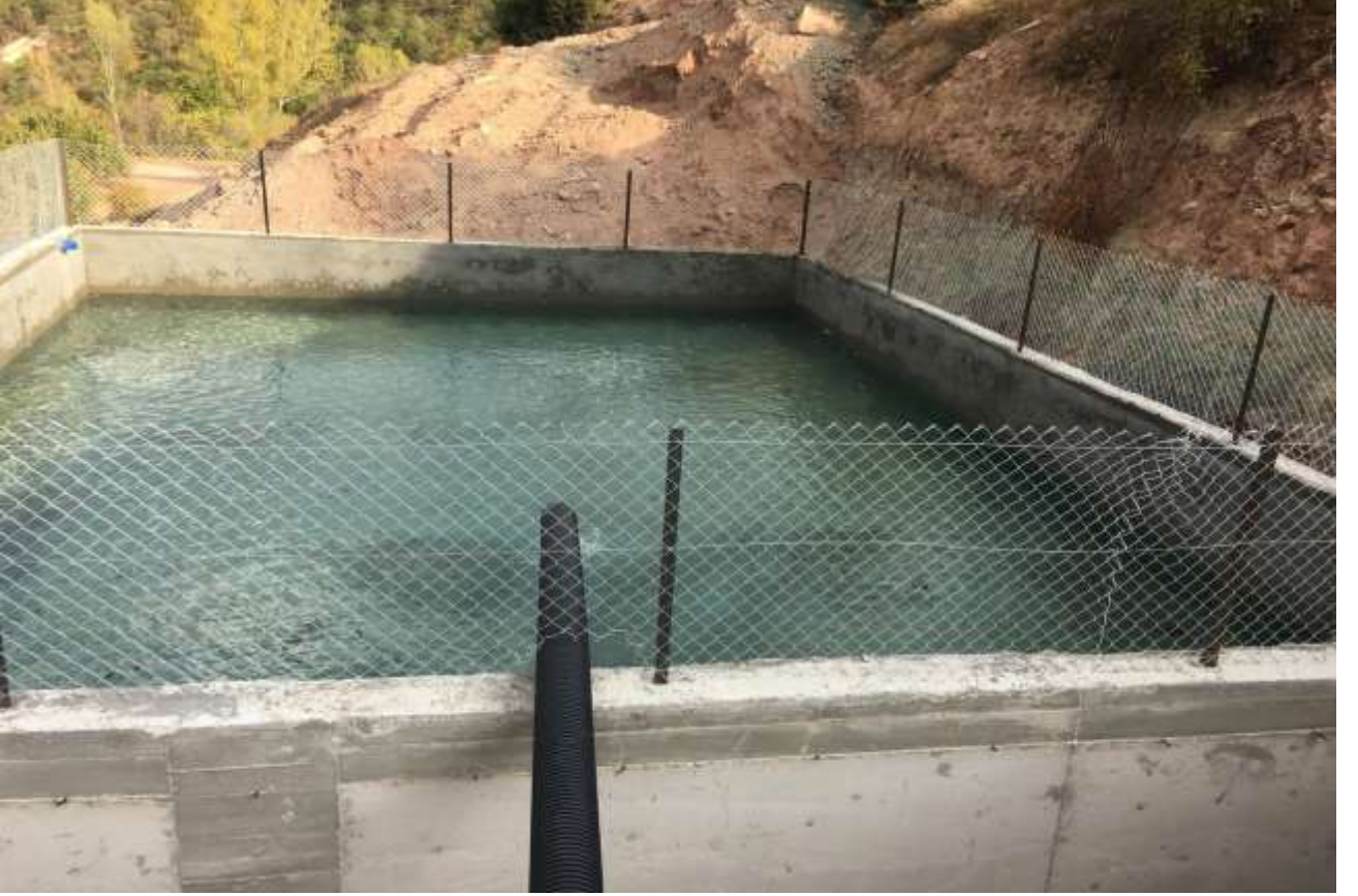
Merkez Pirahmet Köyü Sulama Tesisi Havuzu İşi