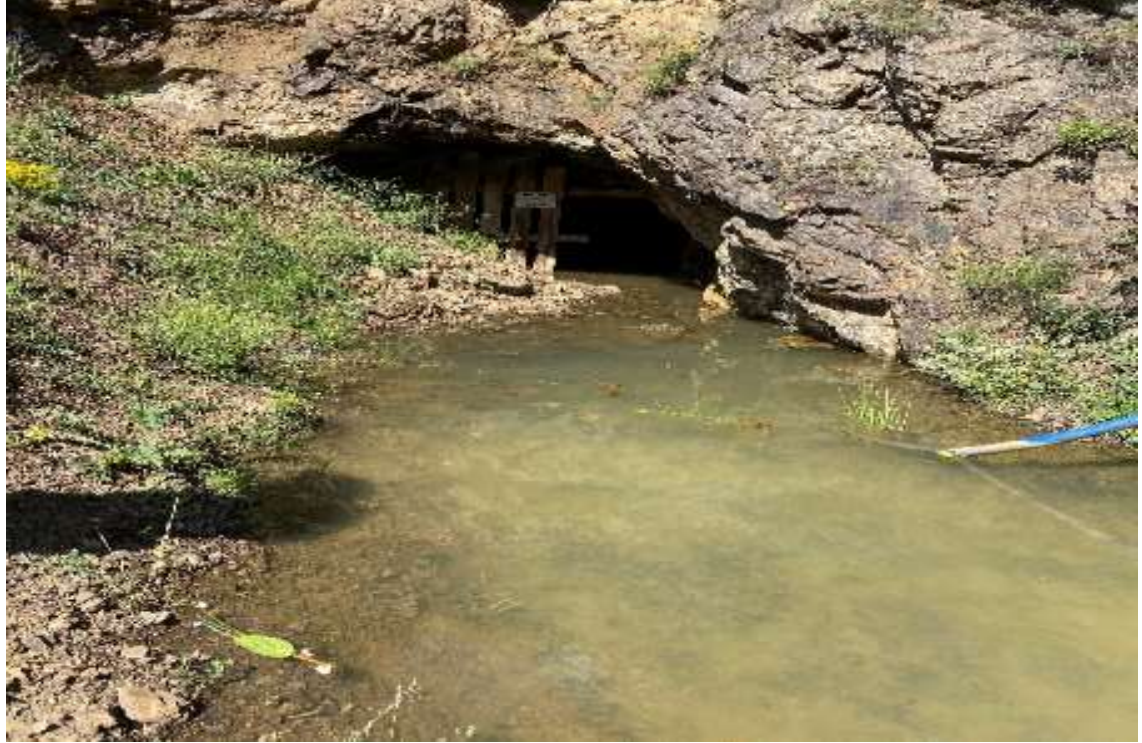
Torul – Arpalı Köyü – Metalik (Kurşun – Çinko) Maden Sahası – Eski Üretim Galerisi ve Cevher Zonu