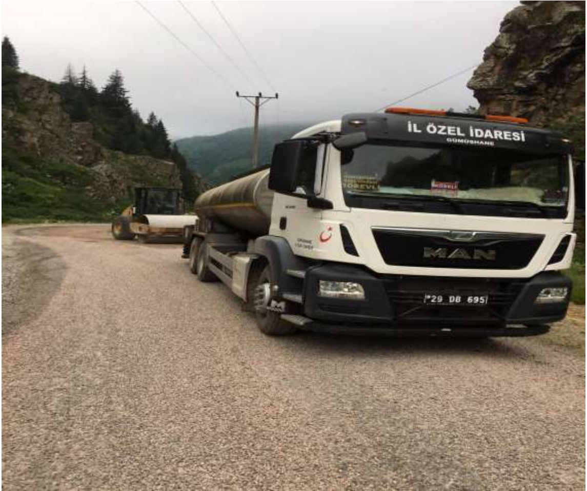
Merkez Boğalı Köyü 2. Kat Asfalt Yapım Çalışmaları