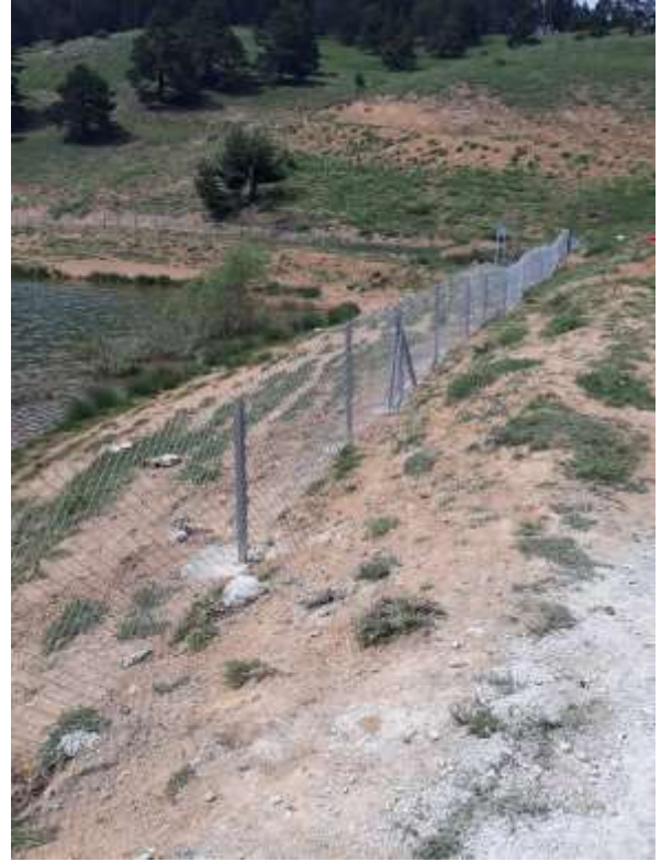
Torul Cebeli Köyü His Gölet'i Tel Örgü İşi