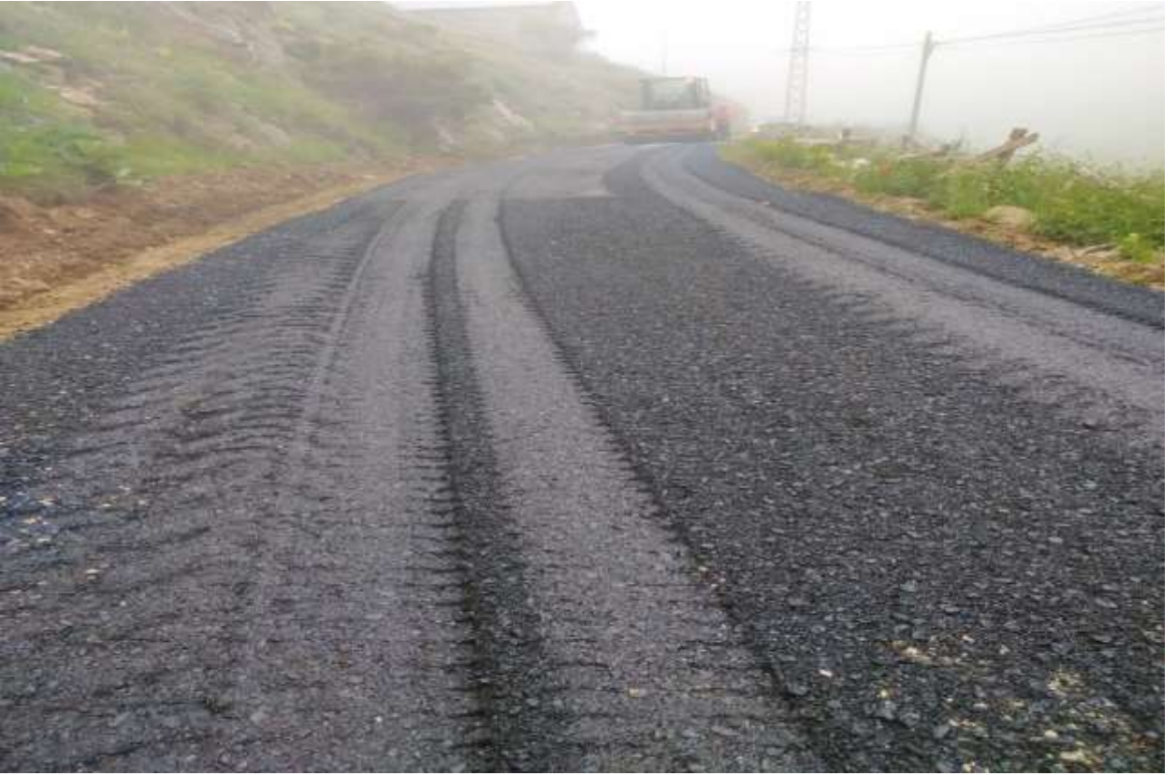
Boğalı Köyü Asfalt Bakım Onarım Çalışmaları