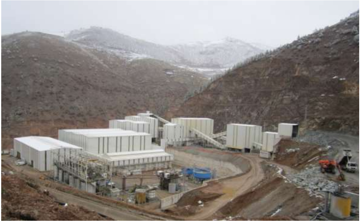
Merkez – Karamustafa Köyü – Maden Sahası - Yıldız Bakır İşletmeleri A.Ş.