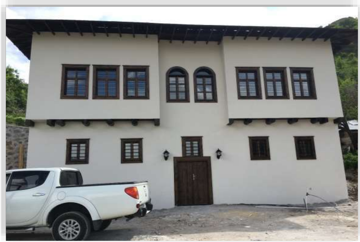
Merkez Eskiciođlu Konađı