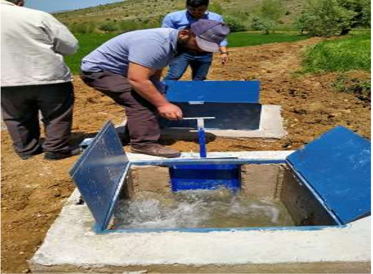
Kelkit Aşut Köyü Sulama Tesisi İşi