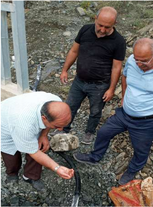
Merkez Kale Limit İçme Suyu İşi