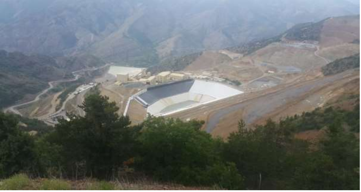
Merkez - Demrikaynak Köyü - Altın Madeni İşletme Sahası - Koza Altın A.Ş.