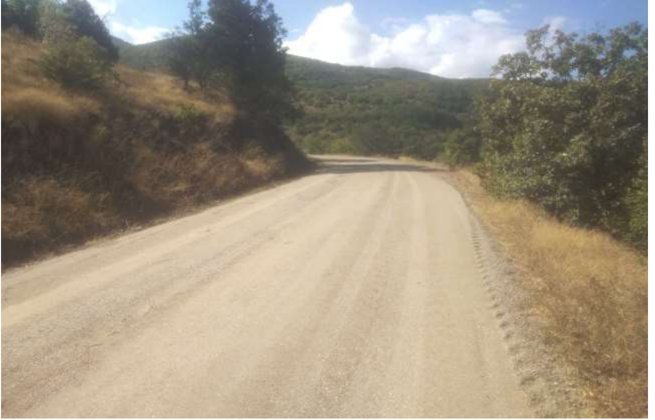
Kelkit Sgtl-Eymr Gup Yolu Stabilize Yol Yapım İŖi