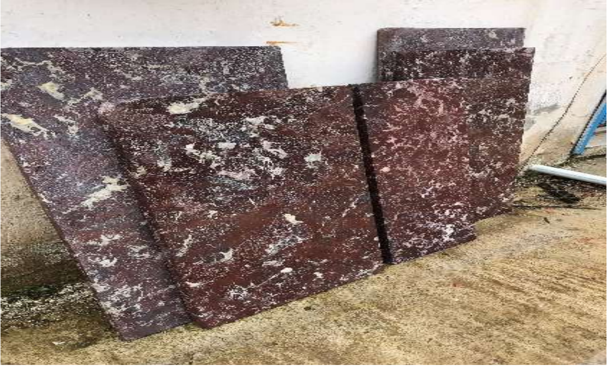
Merkez – İkisü Köyü – Mermer Ocađı