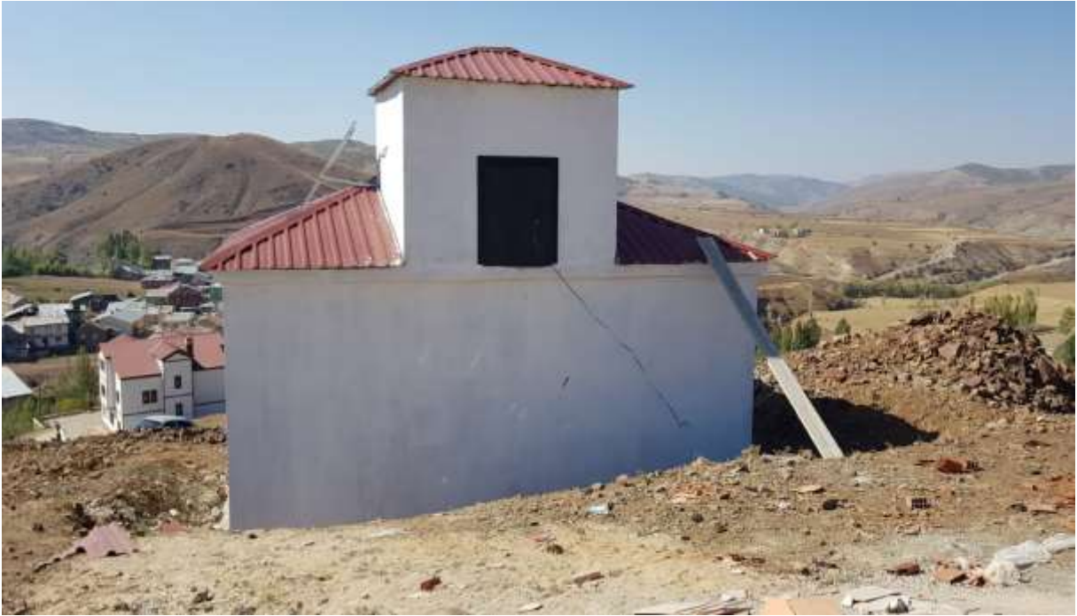
Kelkit Çamur Köyü İçme Suyu Deposu