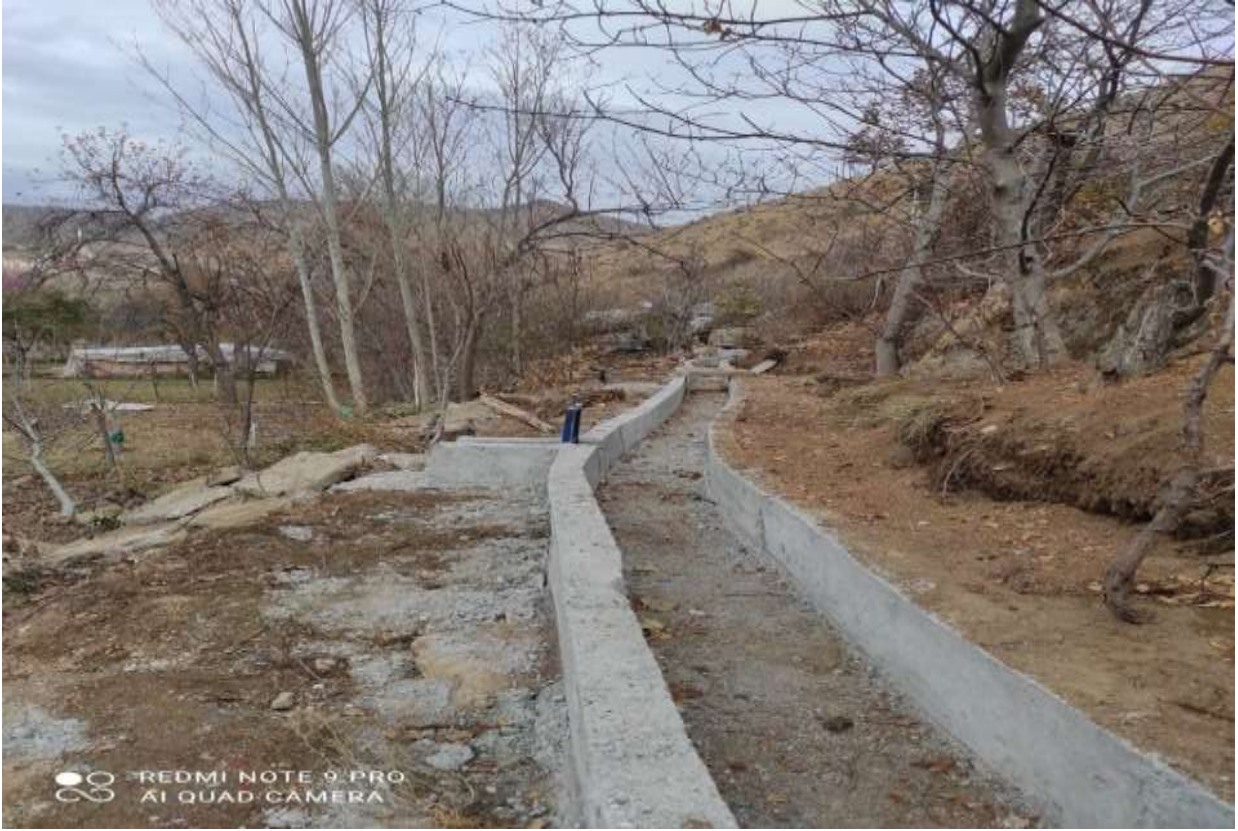
Merkez Yeniöl Köyü Beton Kanal İŖi