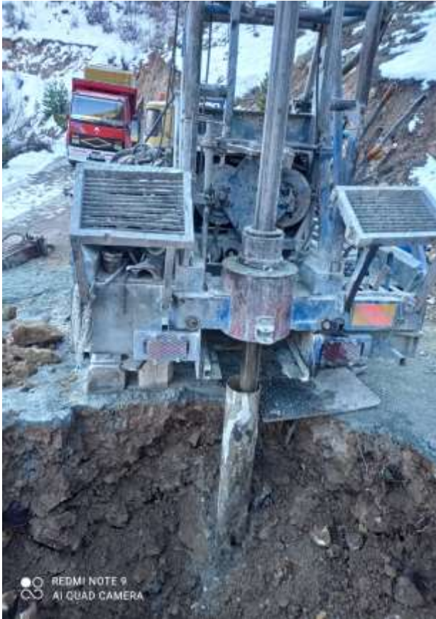
Torul Köstere Köyü Sondaj Çalışması