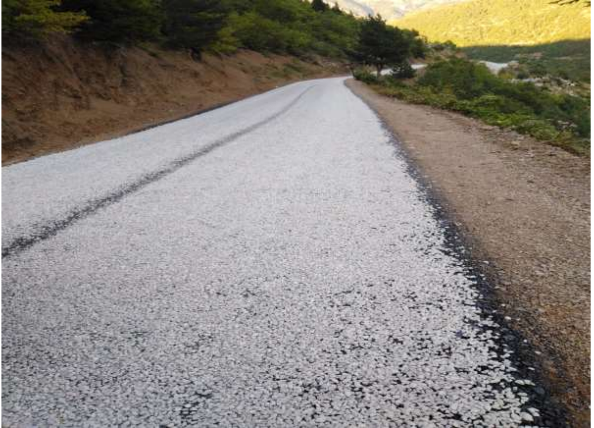
Kürtün Çayırçukur Köyü 1.Kat Asfalt Yol Yapım İşi