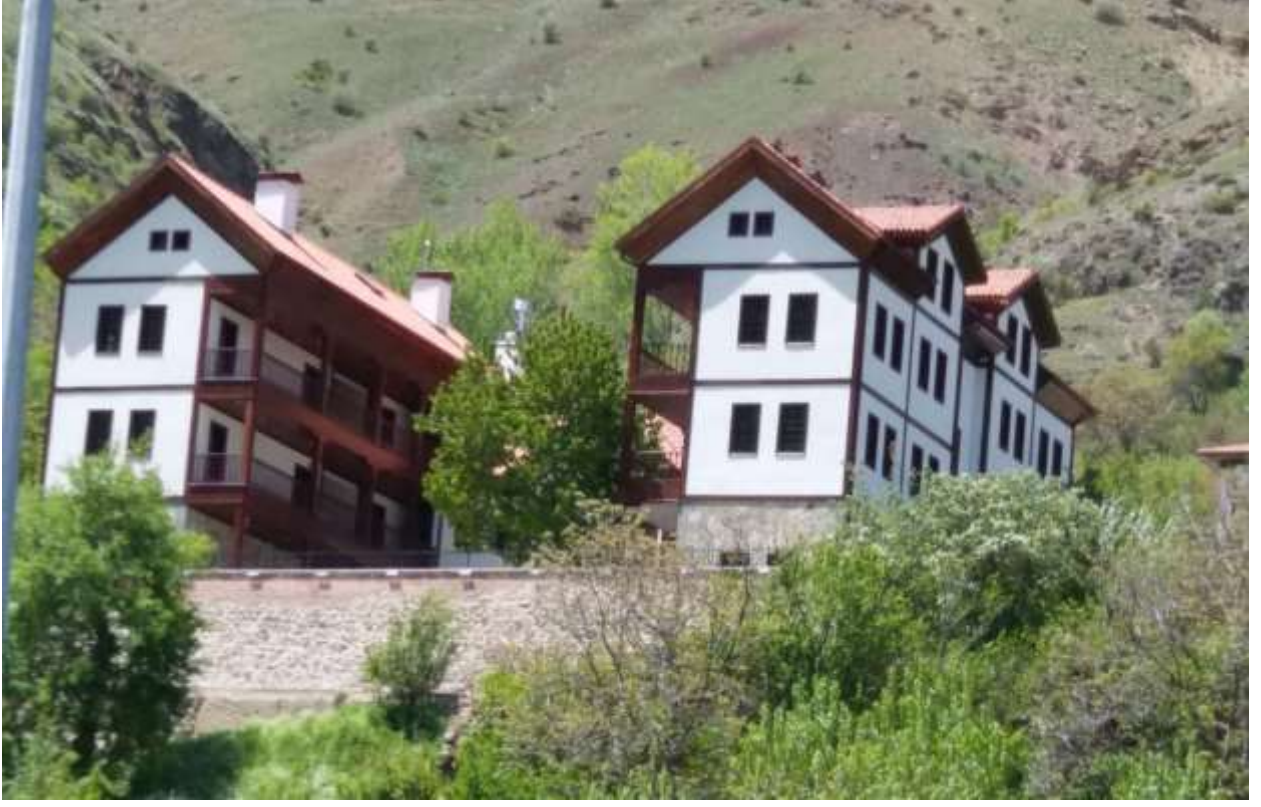
Merkez Süleymaniye Mahallesi Kùltür Kompleksi İkmal İnşaatı İşı