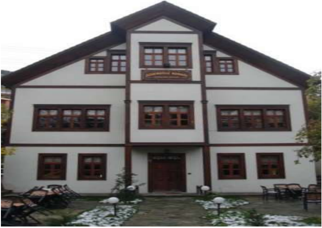
Merkez Özdenođlu Konađı