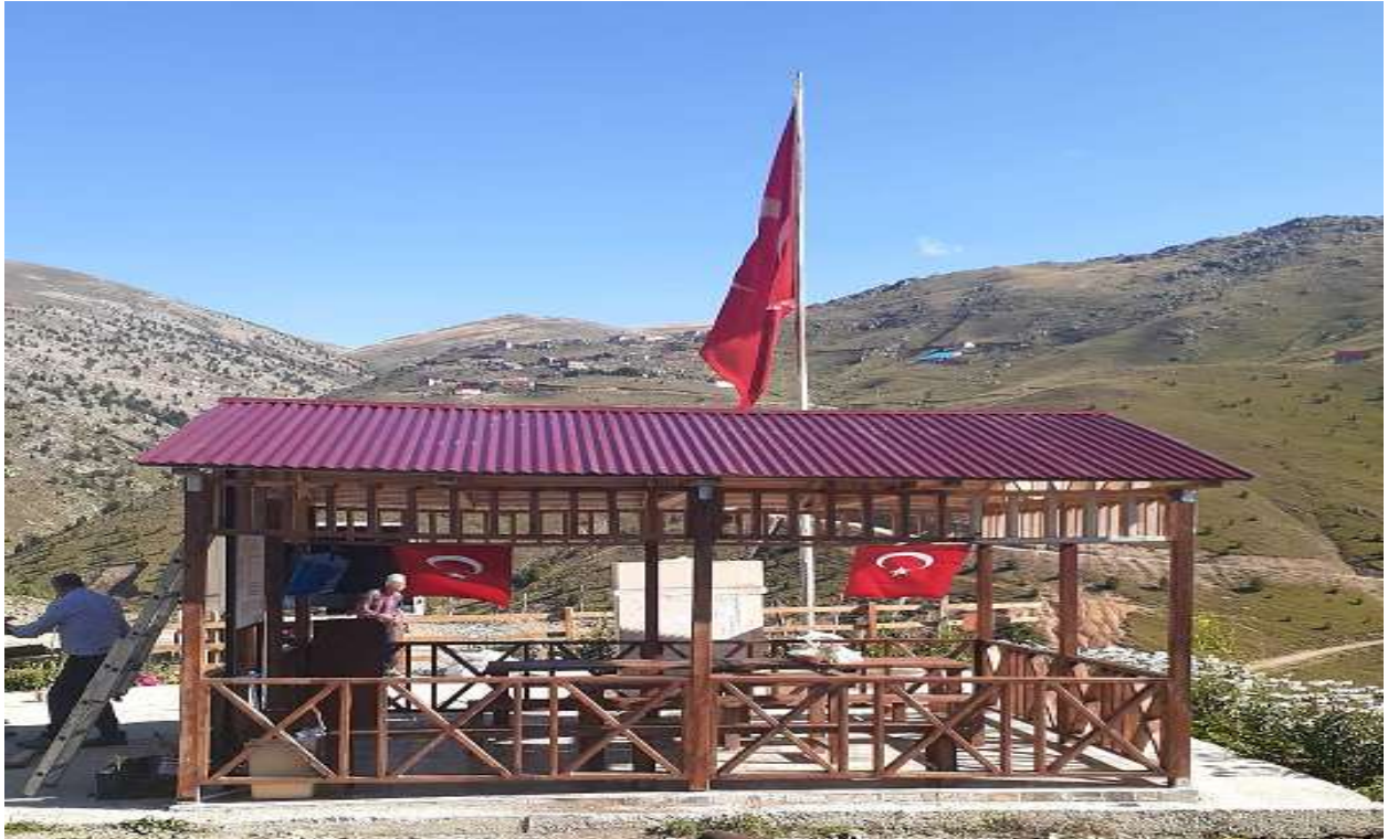
Kürtün Tilkicek Köyü Şehit Çeşmesi Çevre Düzenlemesi İşi