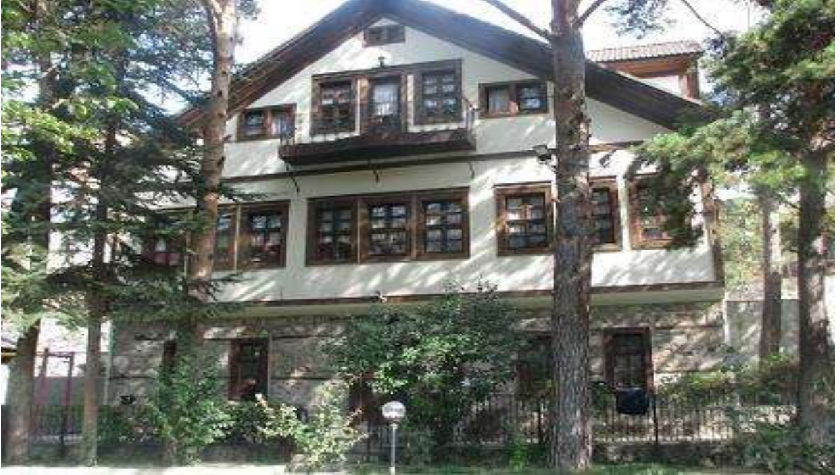
Merkez Ataç Konağı