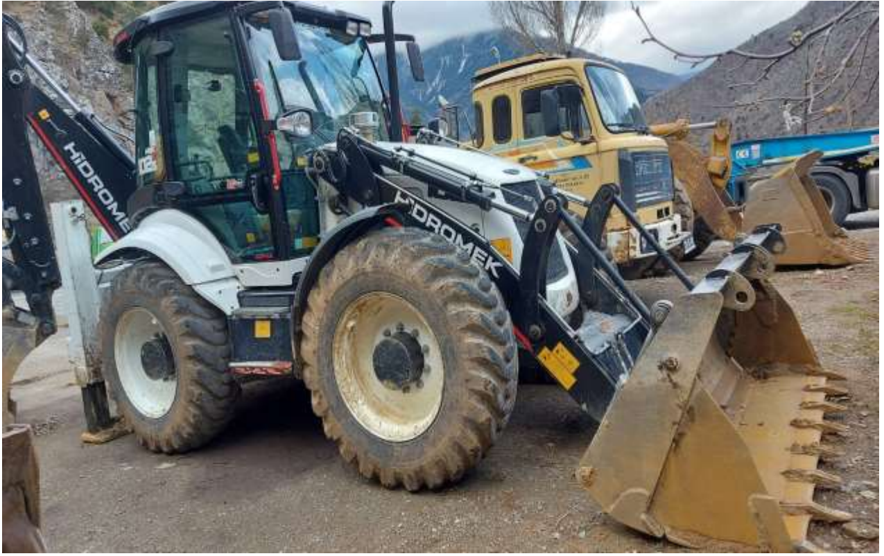
2020 Yılında Alınan Kanal Kazıyıcı - Yükleyci