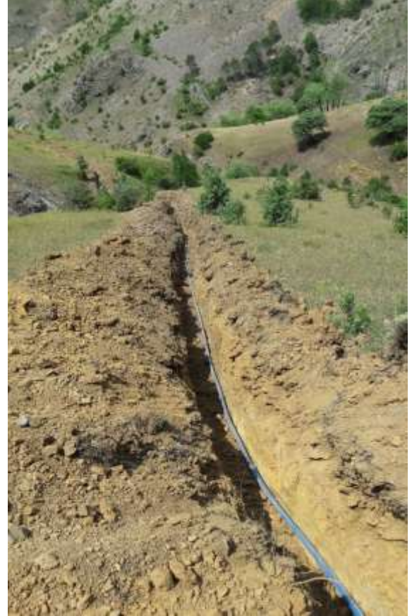
Merkez Yağlıdere Parti mahallesi içme suyu hattı