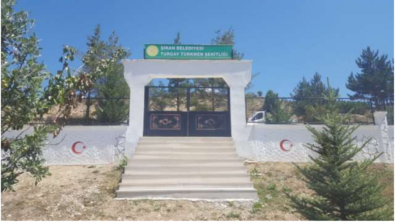
Şehit Turgay Türkmen Mezarlığı