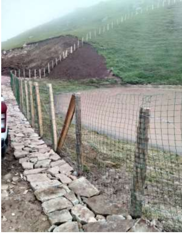
Merkez Dumanlı Köyü Dipsiz Göl Çevre Düzenlemesi İşi