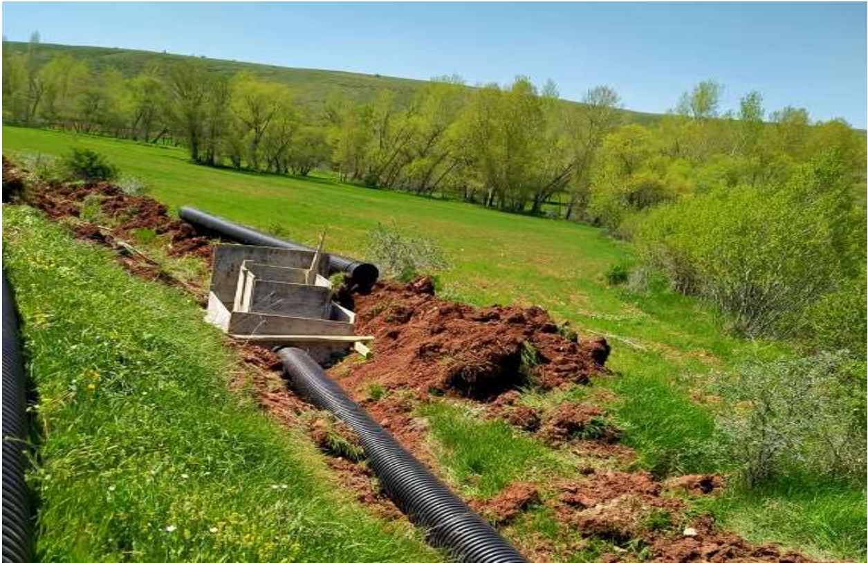
Kelkit AŖut Ky Sulama Tesisi İŖi