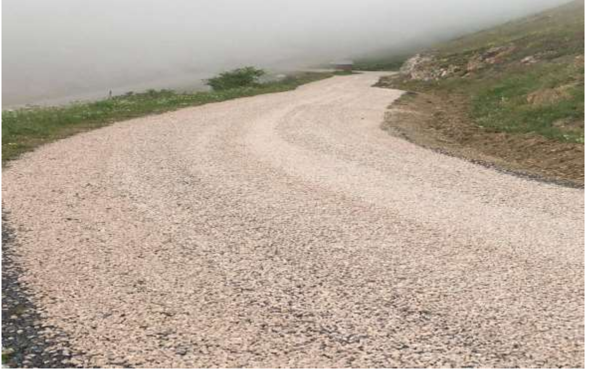
Merkez Boğalı Köyü 2. Kat Asfalt Yapım Çalışmaları