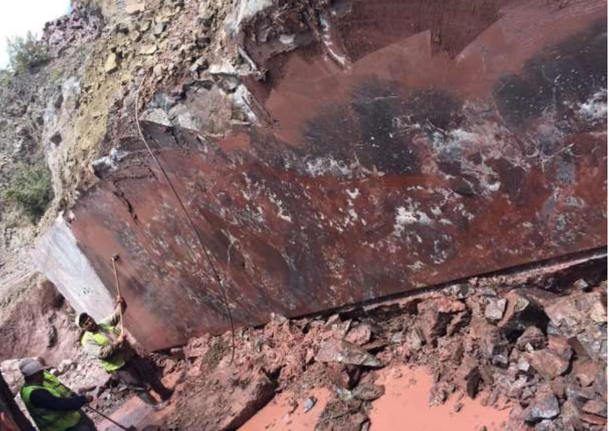
Merkez – İkisü Köyü – Mermer Ocađı