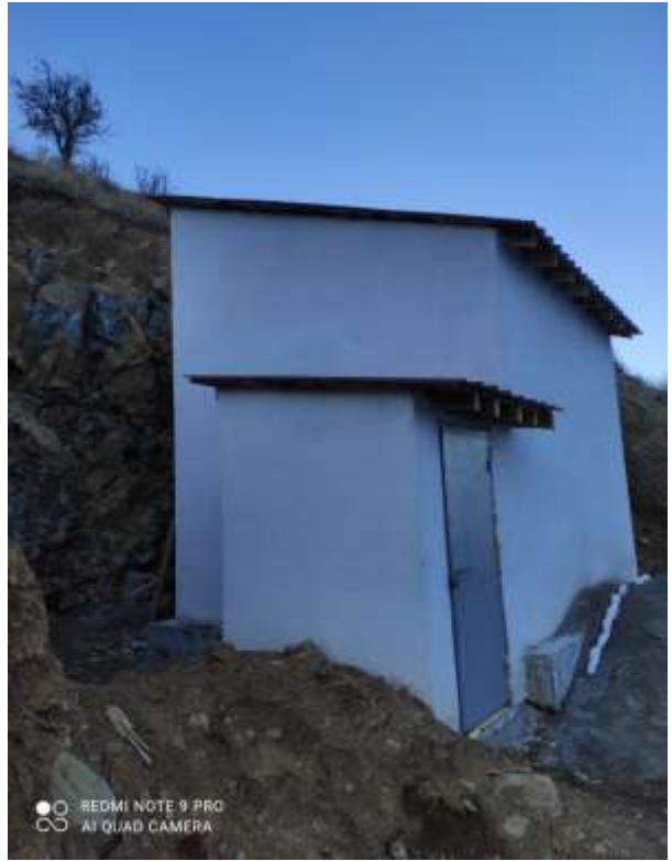
Torul Yücebelen İme Suyu Deposu İşi