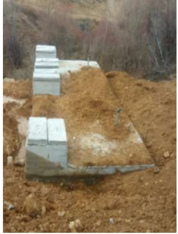
Köse İlçesi Yaylın Köyü Kanalizasyon Hattı Yenilenmesi ve 250 kişilik Foseptik Yapım İşi