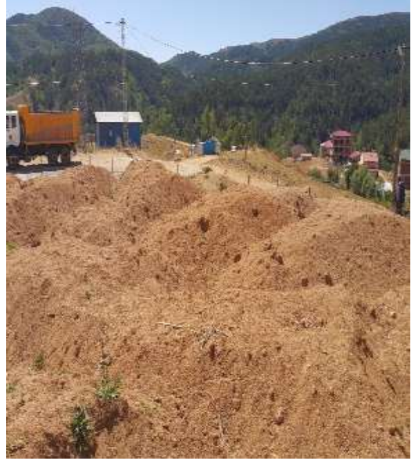
Köse – Subaşı Köyü – Hafriyat Malezmesi İhalesi