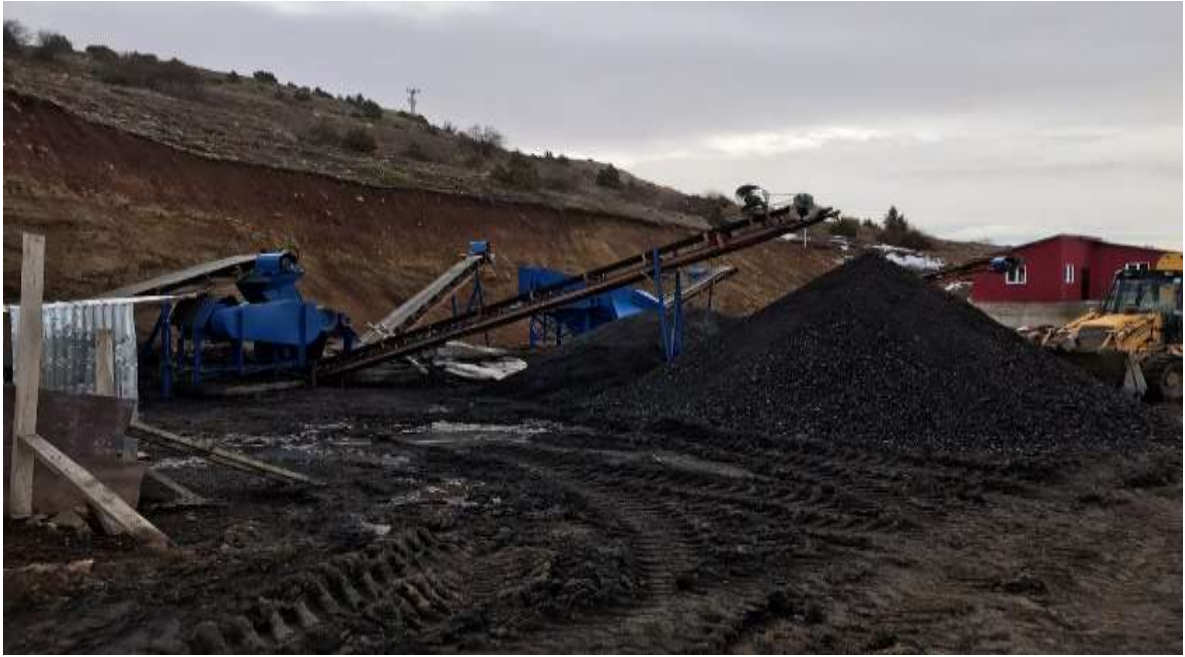
Kelkit – Gümüşgöze Beldesi – Kömür(linyit) Maden Sahası – Kırma Eleme Ünitesi ve Galeri Girişi