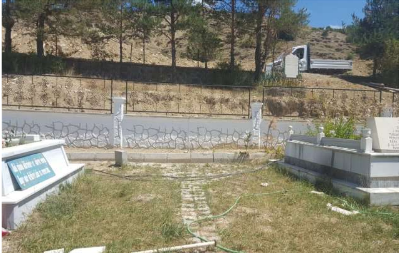
Şehit Turgay Türkmen Mezarlığı