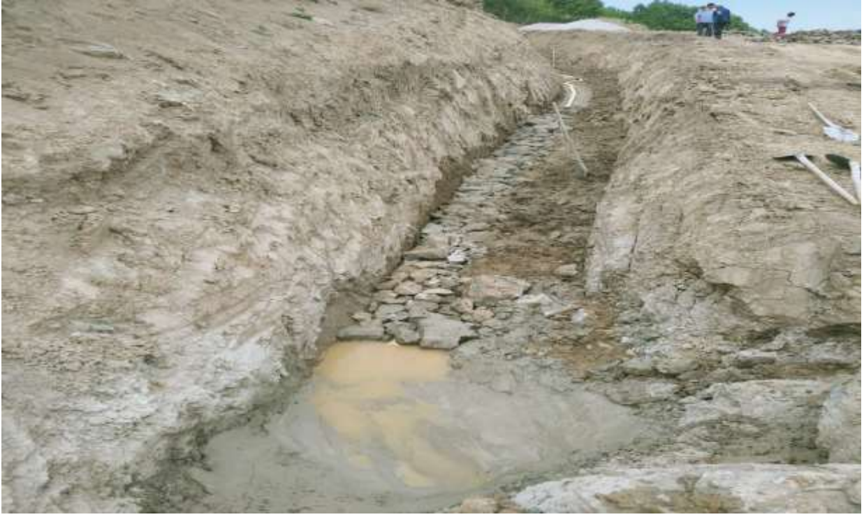
Merkez Ardıç İme Suyu Drenaj Çalışması İşi