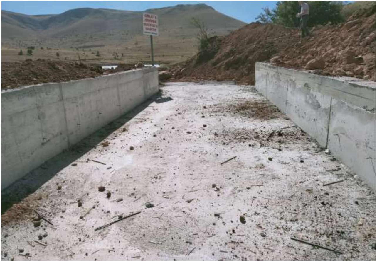
Kelkit Aziz Köyü Gölet'i Dolu Savak İşİ