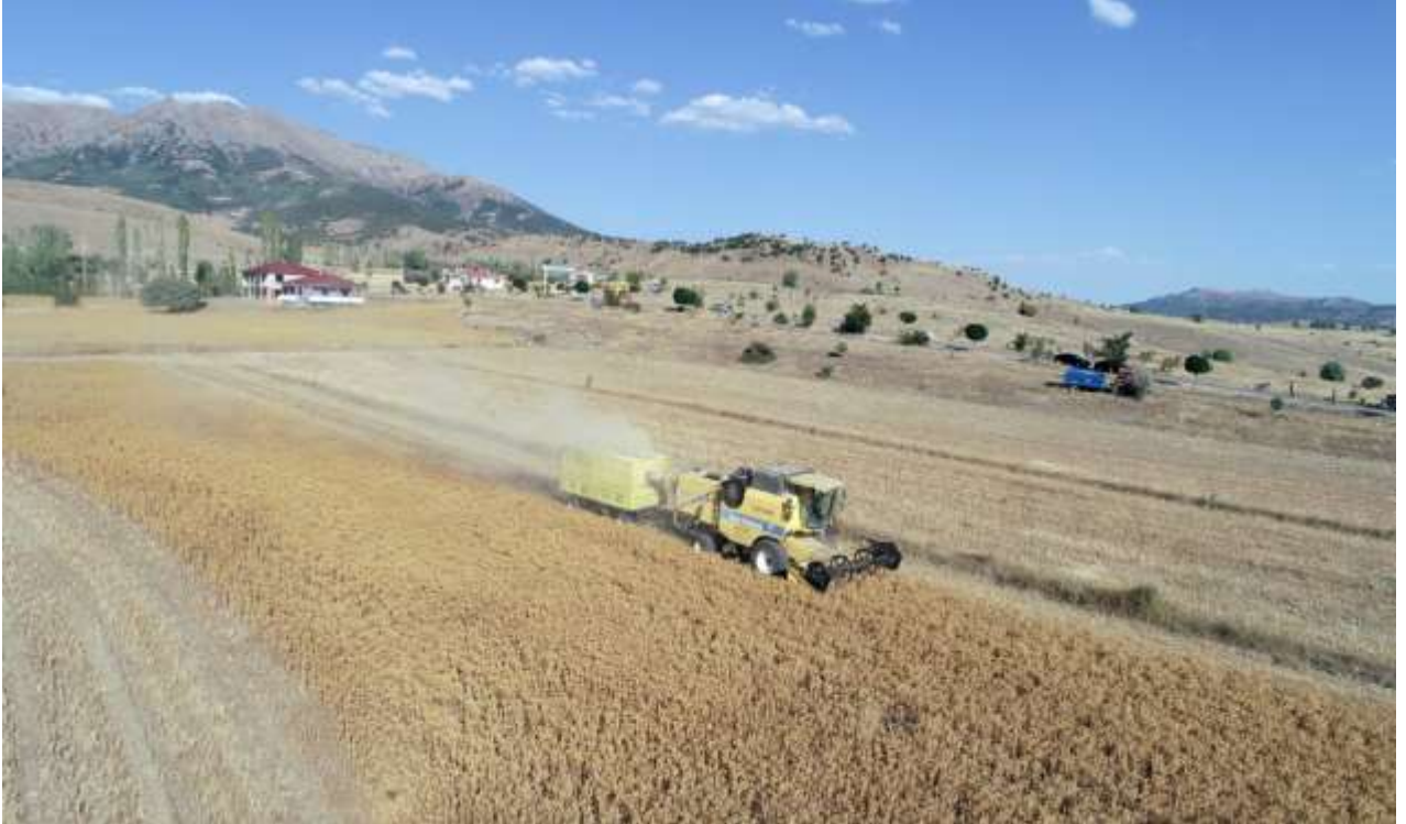
Şiran İlçesi Aspir Yetiştiriciliği Projesi İşi