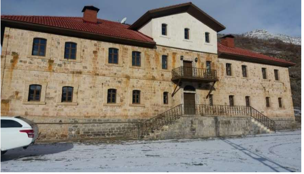
Merkez Yeşildere Konakları