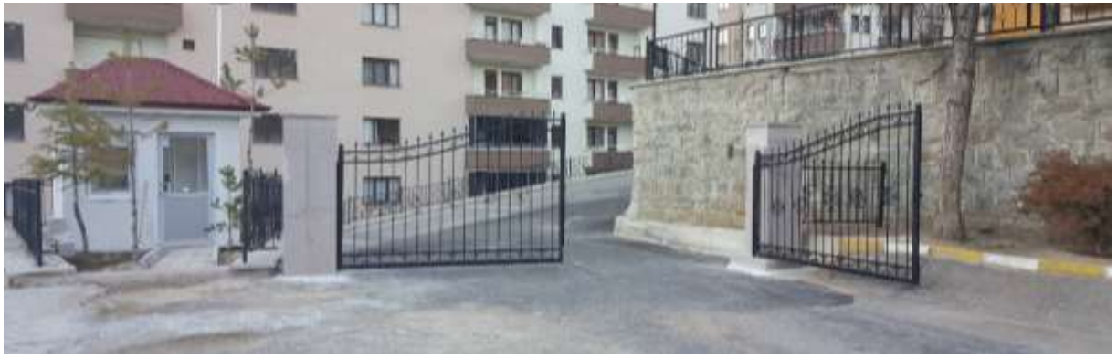
Merkez M. Ç. Sosyal Bilimler Lisesi Bekçi Kulübesi ve Demir Kapı Yapım İşi