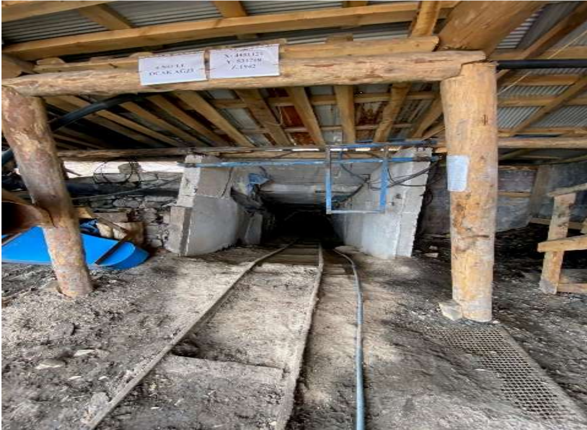
Kelkit – Gümüşgöze Beldesi – Kömür(linyit) Maden Sahası – Kırma Eleme Ünitesi ve Galeri Girişi