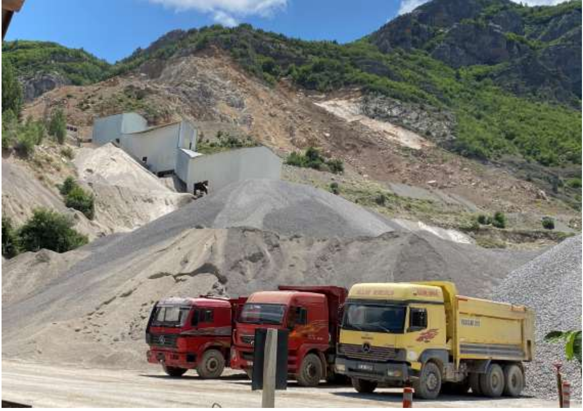
Torul – Gülaçar Köyü – Kalker Ocağı ve Konkasör Tesisi