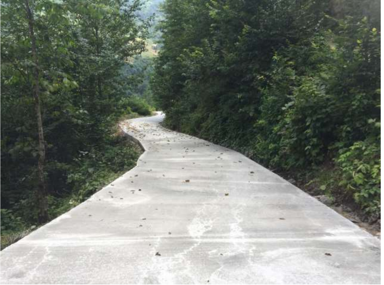
Merkez Dumanlı K y  Koball  Mahalle Yolu Beton Yol Yapım İŐi