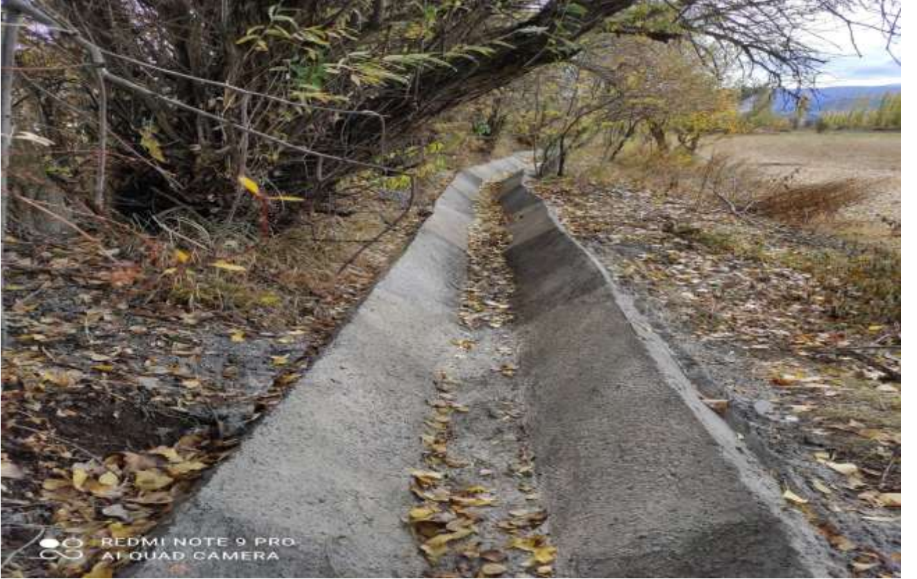
Şiran Aksaray Köyü Beton Kanal İşi