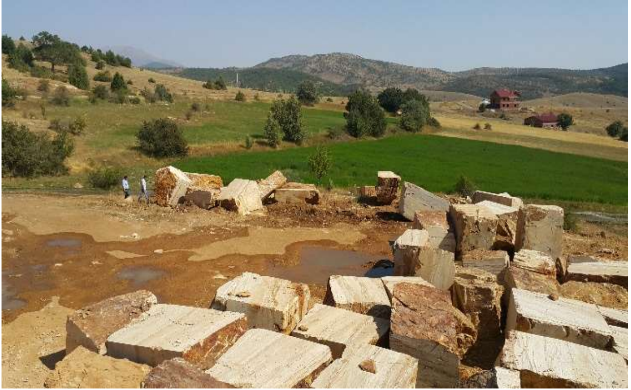
Şiran – Telme ve Bahçeli Köyleri – Bazalt ve Traverten Mermer Ocakları