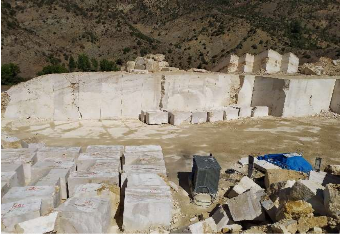
Torul – Kalcik Köyü – Traverten Mermer Ocağı