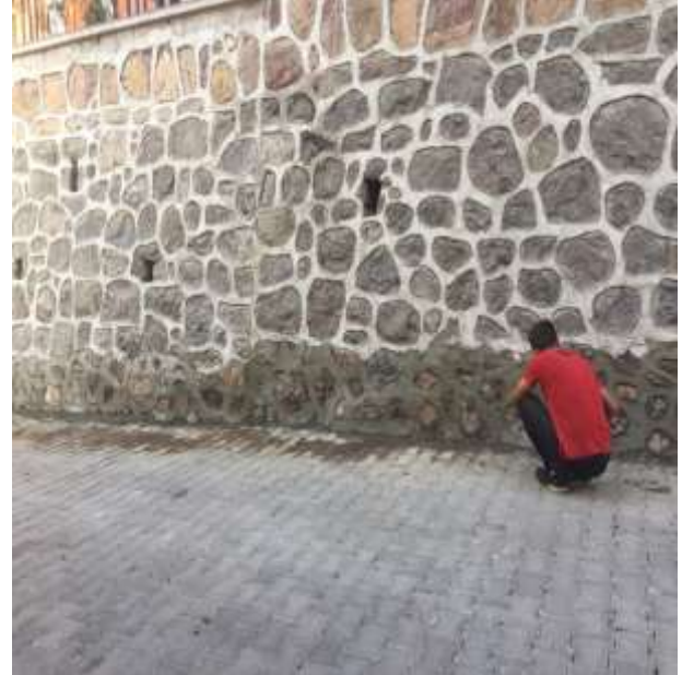
Merkez Mesleki ve Teknik Anadolu Lisesi Onarım İşi