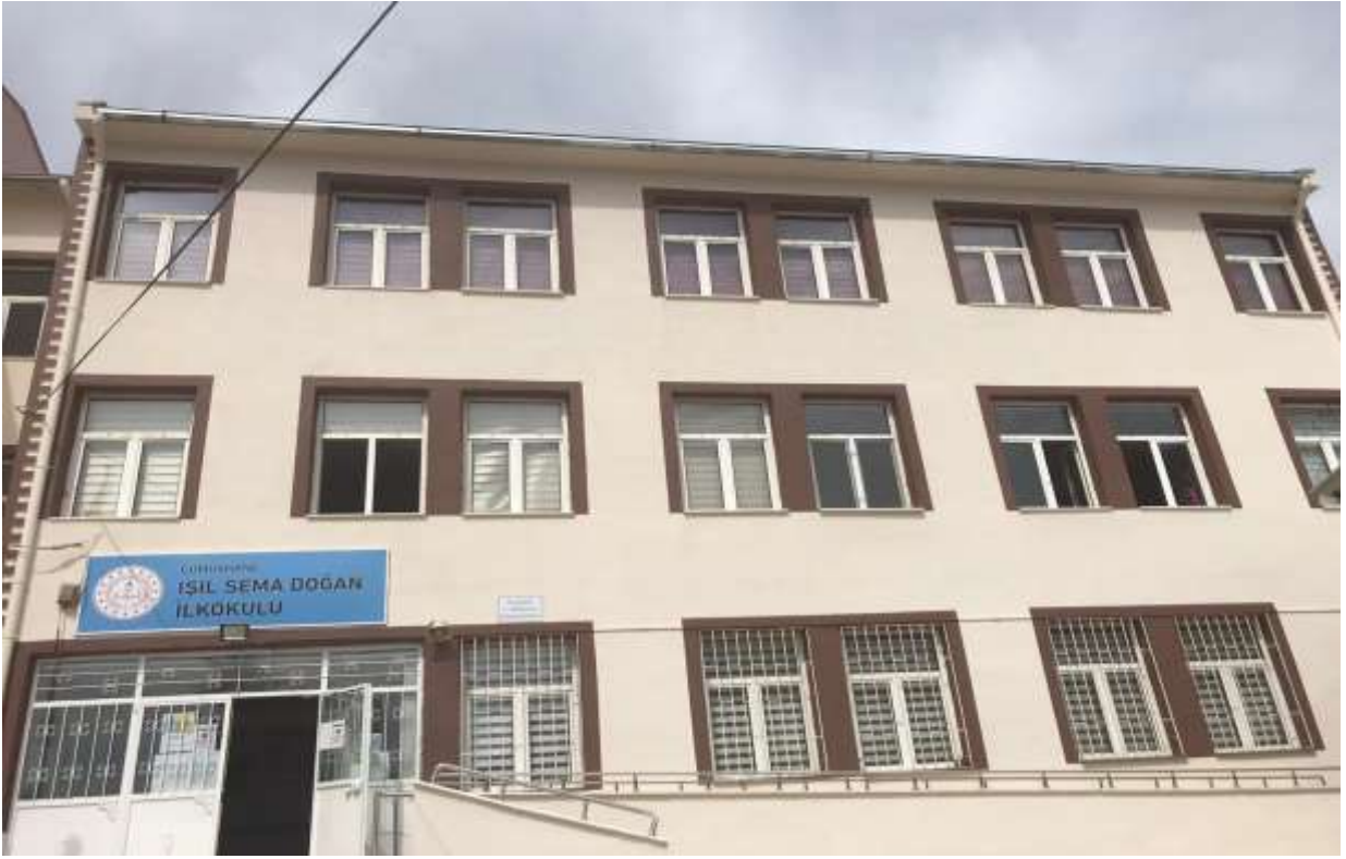
İşil Sema Doğan İlkokulu Onarım İşi