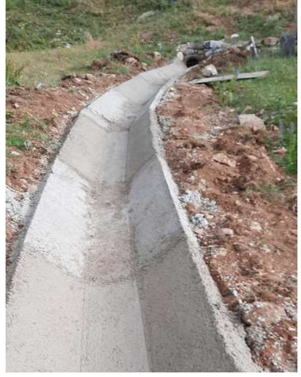
Köse Bizgili Köyü Beton Kanal İşi