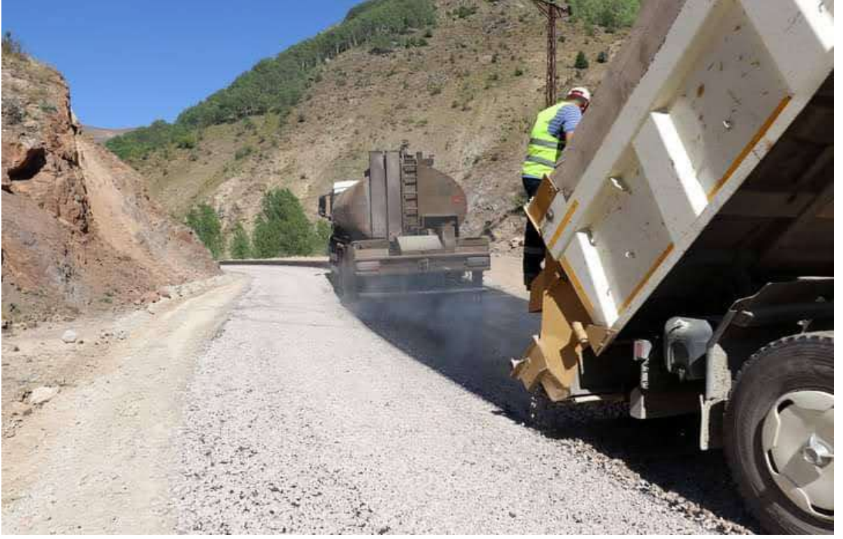
Yağlıdere Krom Mahalle Yolu 1. Kat Sathi Kaplama Çalışmaları