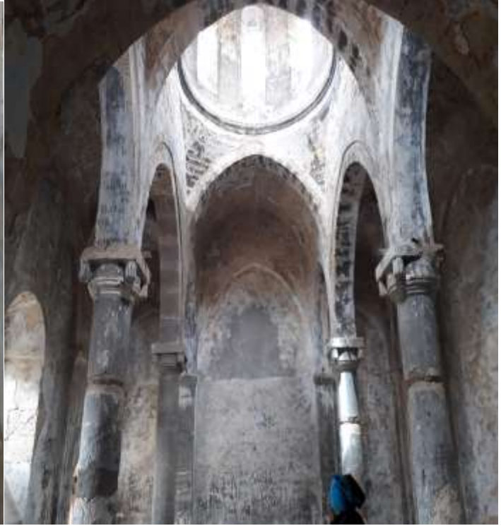
Merkez Olucak Köyü İmera Manastırı Onarım İşi (2. Kısım)