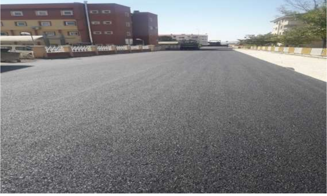
Kelkit Belediyesine İlçe Merkezinde Protokolle Yapılan Finiřerli BSK Yol