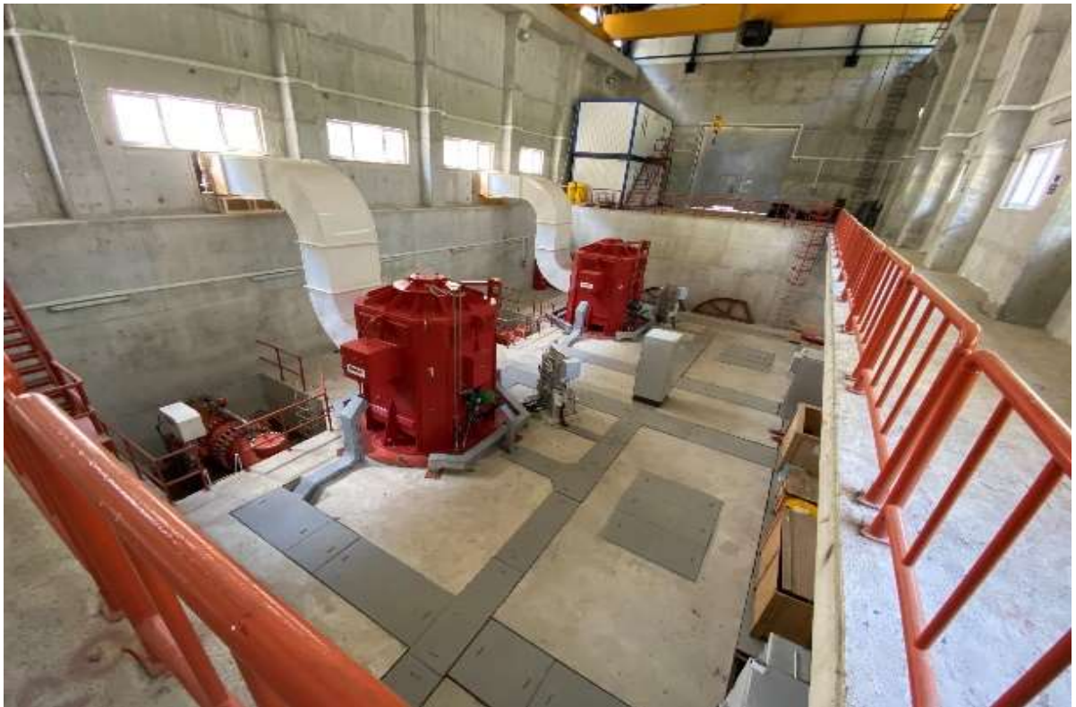
Torul – Gzeloluk Ky- Hidroelektrik Santrali