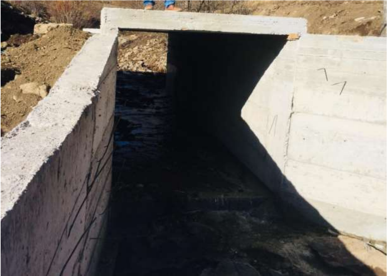
Merkez İkisu Köyü Menfez Yapım İşi