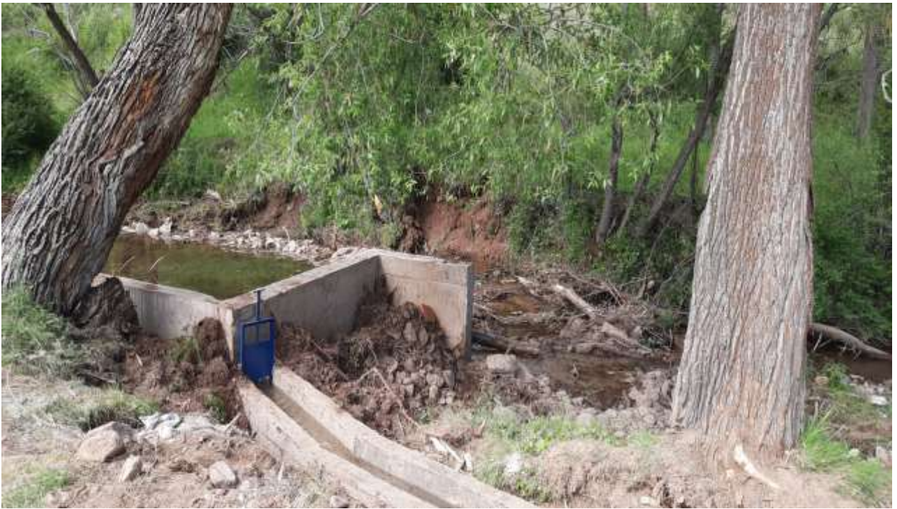
Merkez Gökdere Köyü Sulama Bendi İşi