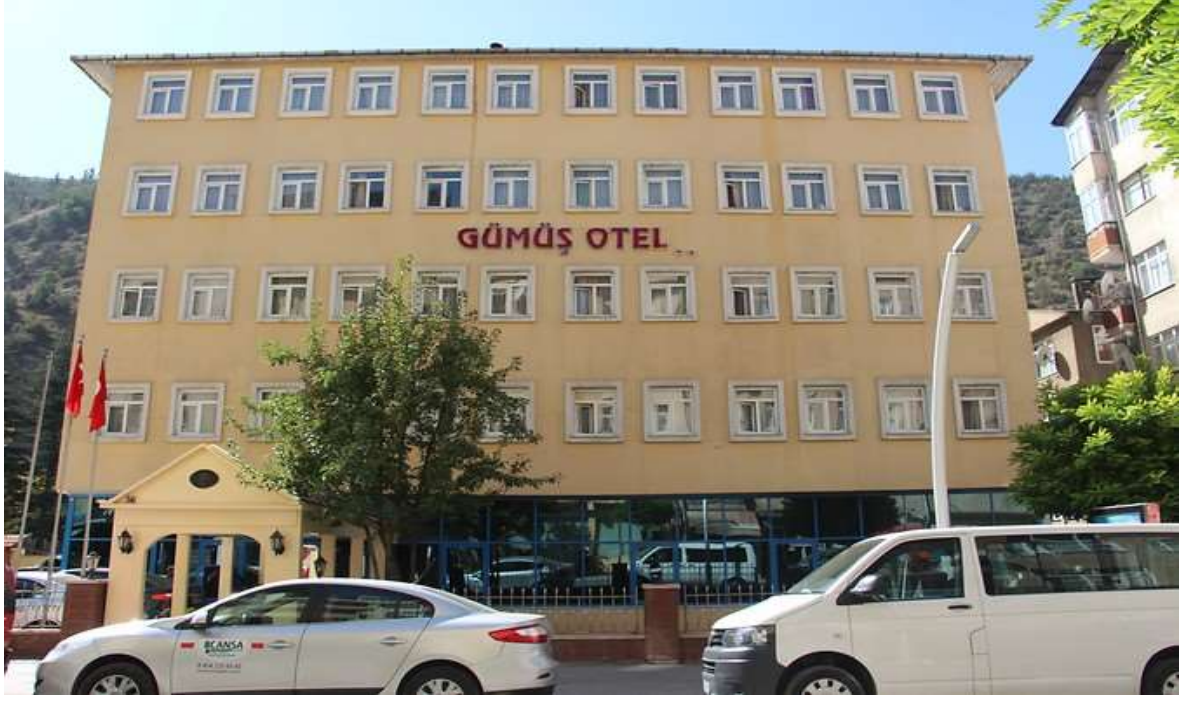
Merkez Gümüş Otel