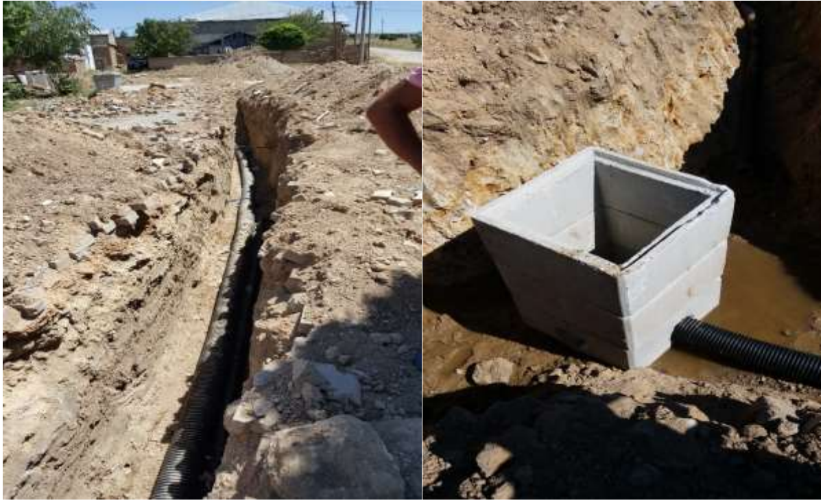
Köse İlçesi Salyazı Köyü Kanalizasyon Hattı Yapım İşi