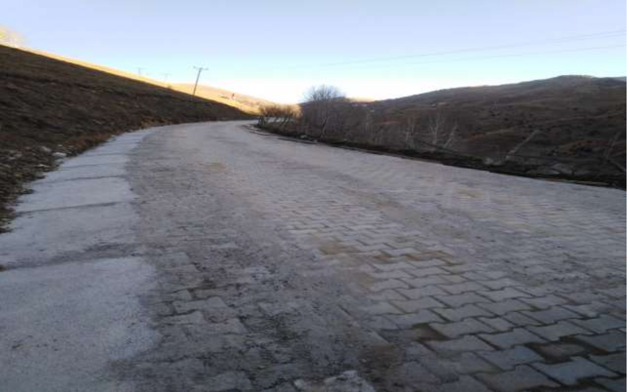
Kürtün Kazıkbeli-Tilkicek Grup Yolu Parke YolYapım İşi