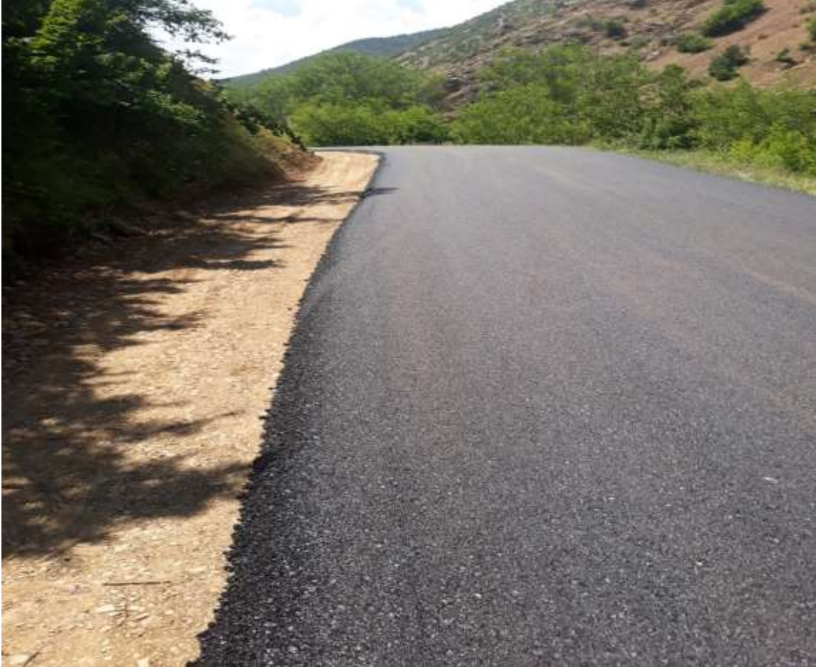
Merkez Üçkol – Kurtođlu Grup Yolunda Finiřerle Yapılan BSK Yol