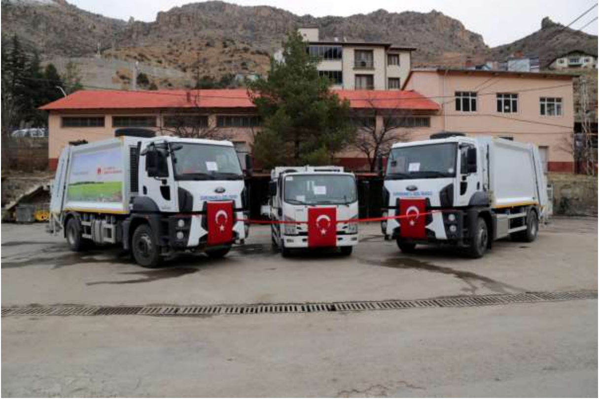
2020 Yılında Alınan Çöp Kamyonları